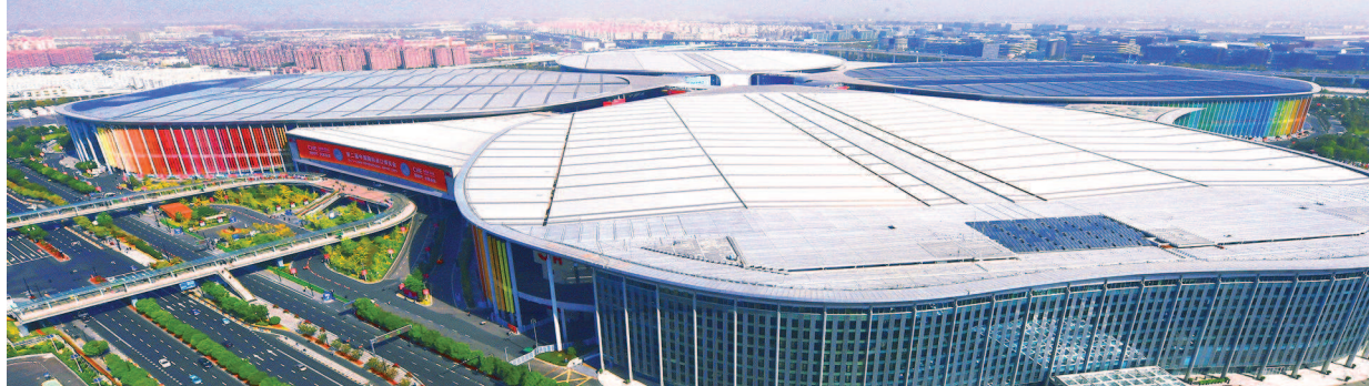
制图:李洁