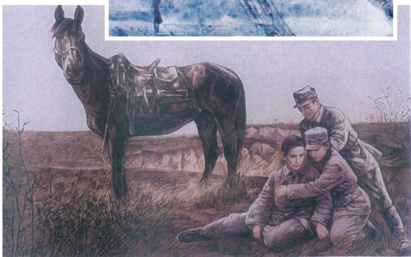
▼尤山连环画《激情斗士史沫特莱》

最近，藏在长乐路672弄巷子深处的上海人民美术出版社整修一新，开放式草坪与底楼小展厅组成“一百零八上苑”面向公众开放。这个名字，致敬的是曾汇聚于此的有着“一百零八将”之称的雄厚连环画作者队伍，而草坪上新添的“中国连环画的摇篮”石碑，亦勾连起这座城市各感骄傲的一段历史。