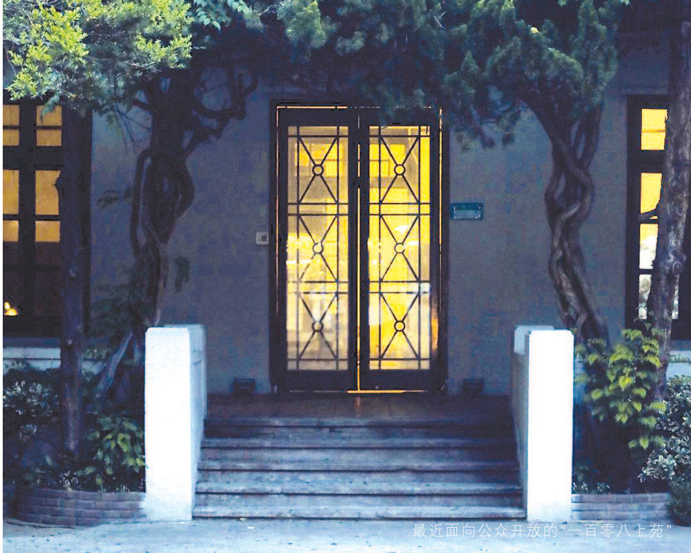
最近面向公众开放的“一百零八上苑”