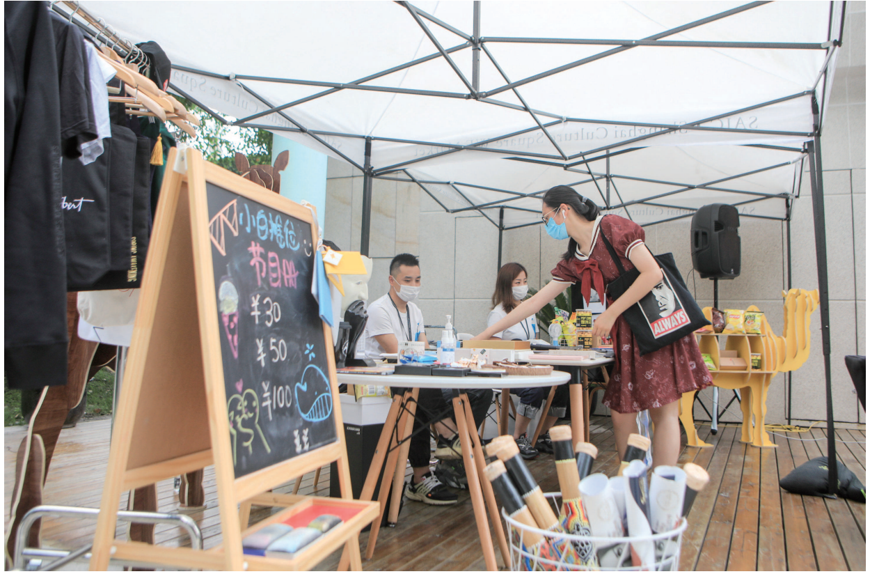
文化广场日前举行剧院开放日,文创市集和手工制作吸引观众前来体验。

这些年来,上海的户外音乐会在观众心中留下无数美好瞬间,离不开台前幕后工作人员的精细化管理。比如申城夏天变幻莫测的天气,往往对户外音乐会的观众体验造成诸多影响。而上海夏季音乐节近年来在城市草坪广场举行的音乐会,就充分考虑了高温和下雨等状况。“我们对入场的每位观众都分发驱蚊贴、清凉油等消暑防护用品大礼包,也给他们准备雨衣。”上海交响乐团团长周平告诉记者,正是这些以人为本的举措,让人本价值落实到了城市艺术生活的各个角落。