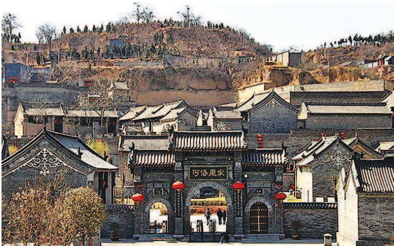
▲唐百万庄园,又名河洛康家,位于河南省巩义市康店镇,始建于明末清初,被誉为豫商精神家园,中原古建典范