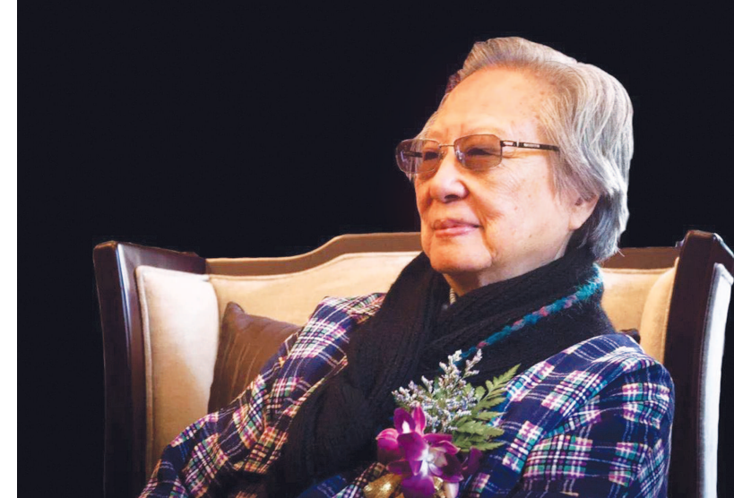
泰斗级书画大家陈佩秋。(资料照片)

国画创作方面,她以对青绿山水的探索,大胆结合西方绘画的色彩,开创了彩墨结合的中国画新风,成为中国画创新的一个生动典范。她师古而不泥于古,同时又以开放的胸襟接纳西方的绘画艺术,尤其是对于印象派画家莫奈、德加、雷诺阿等,只要对自己的创作有所启发,皆能吸收借鉴成为灵感源泉。正是这样包容兼蓄的艺术精神使得她在艺术上取得了卓尔不凡的杰出成就,让历史悠久的传统中国画重新焕发出新的光彩。