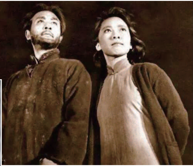
▲于蓝和赵丹在《烈火中永生》里塑造了江姐和许云峰这对革命伴侣。