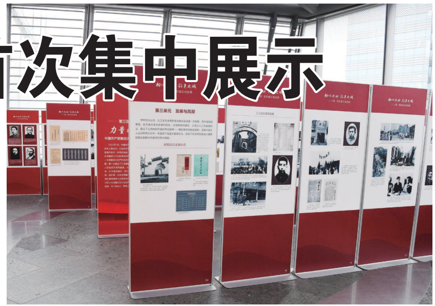
“初心之地 红色之城”——上海·党的诞生地巡展启动。

巡展第一站设在上海中心党群服务中心,将展出至7月10日。之后,该展览将在市级机关集中办公地、上海教育电视台、各区党建服务中心等进行巡展,助力党员上好“四史”必修课。此外,主办单位还将把展览送出去,依次在广州、井冈山、长三角等地展出,传递上海的红色记忆,彰显中国共产党的红色之魂。