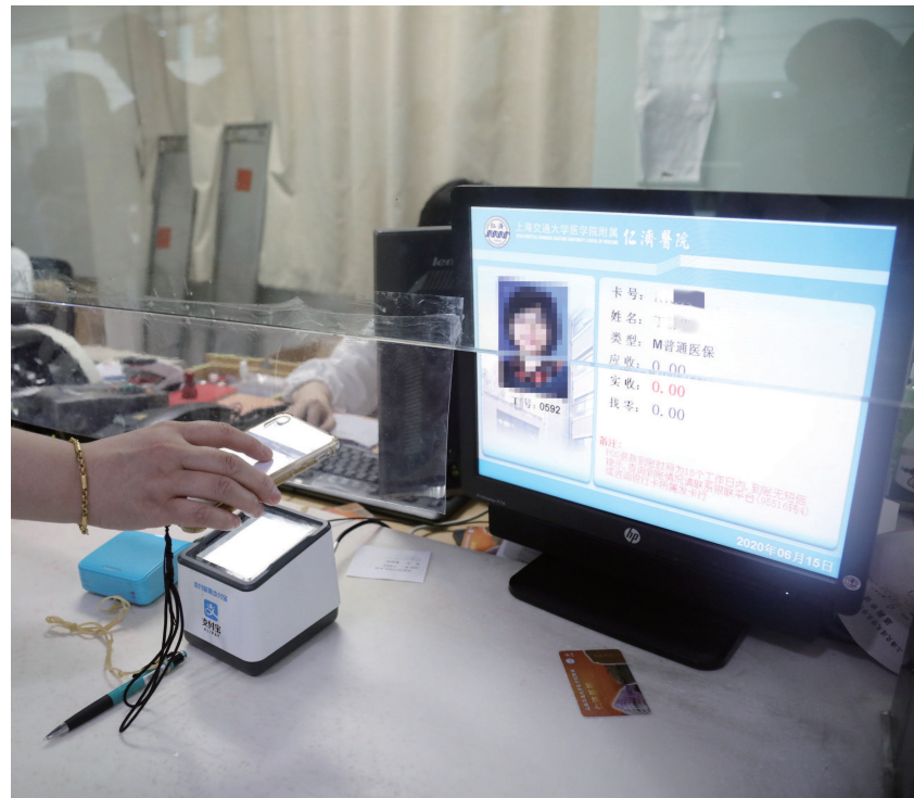
病人通过手机申请“医保电子凭证”即可进行医保在线结算,仁济医院成为上海首家实现“医保卡脱卡支付”的三级医院。

这一看病新方式上海其他医院也在推进。医保电子凭证通过实名、真人认证技术,采用加密算法形成,目前的业务场景包括医保查询、医保购药、医保挂号等