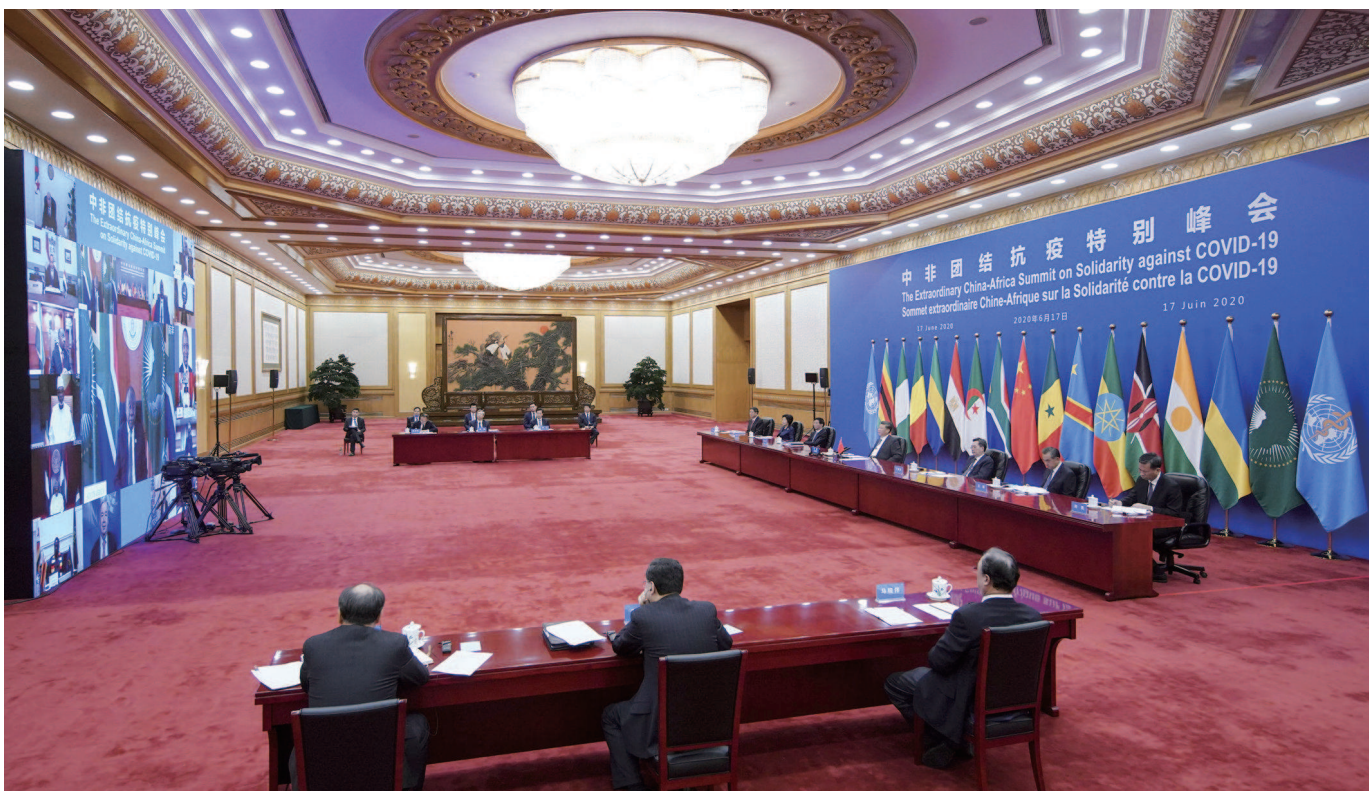
本次峰会由中国和非洲联盟轮值主席国南非、中非合作论坛共同主席国塞内加尔共同发起,以视频方式举行。