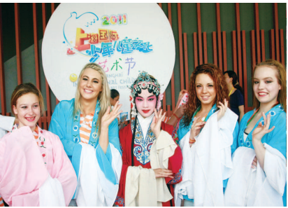
习民族文化艺术提供了更为丰富、灵活的选择。

融合教育资源 推广优秀传统文化。 优秀传统文化博大精深、源远流长，蕴含着极其丰富而又珍贵的思想精神财富，中小幼学校承担着文化传承的神圣使命，是传统文化教育的重要阵地。在杨浦区教育局的重视支持下，杨浦区少年宫联动学校、社会、家庭建立了“华韵艺趣坊-中小幼学生传统文化传承教育体验中心”等相关机构，在开展各类公益性传统文化培训及活动的同时，将民族文化教育融入学校艺术教育常规，打通了民族文化教育区域普及的体制壁垒，辐射渗透全区近百所中小幼学校，大大提升了民族文化教育的区域覆盖率。不仅如此，杨浦区少年宫将课程资源建设放在重中之重的位置，针对不同层次、年龄、需求的学生，不断推进区域民族文化传承教育课程体系的完善，编写了三大序列、26门民族文化传承教育课程，形成了技艺培训与活动体验相结合、长短课程有机结合、内容有序衔接的课程样态，为广大中小幼学生学