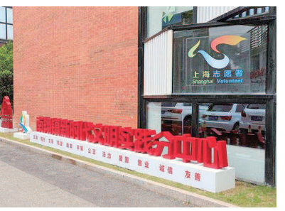
为了不断提升群众思想觉悟、道德水准、文明素养和全社会文明程度，让基层群众享受到更多实实在在的惠民服务，南翔镇依托上海志愿者，成立了新时代文明实践分中心，旨在建立南翔百姓学习宣传、团体实践、展示新时代新思想新理论的文明实践志愿服务平台，形成“群众、组织点

少先队员们向先锋学习的步伐从未停止，同学们通过观看云课堂学习疫情和防护相关知识，在做好自我防护的同时，同学们还积极地通过手抄报、写书信、录制短视频等