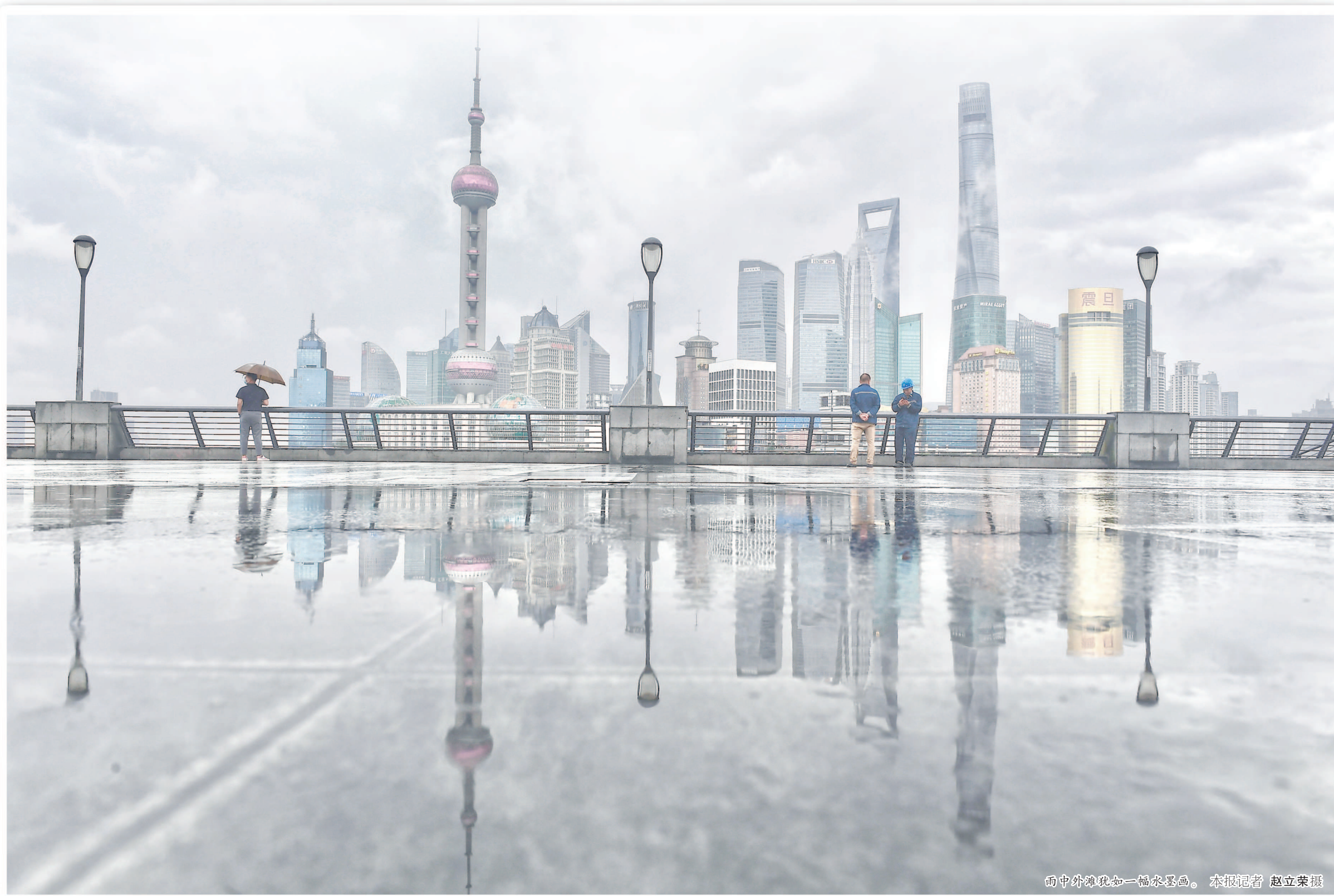
雨中外滩犹如一幅水墨画。

芒种是进入夏季的第三个节气，芒种时节的气候特征是气温升高，雨量充沛。上海近期天气闷热，昨天一场应景的大雨下得酣畅淋漓。