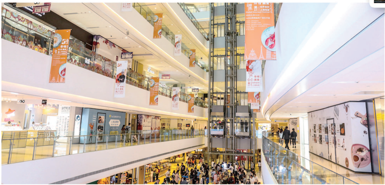
▲昨天，在LuOne凯德晶萃广场B2层，2020“寻味魔都·环球美食”上海环球美食节拉开帷幕。