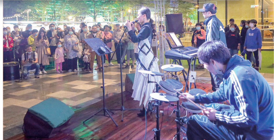
▲“安义夜巷”昨天重新开放，夜巷一侧的音乐舞台吸引众多观众驻足聆听。