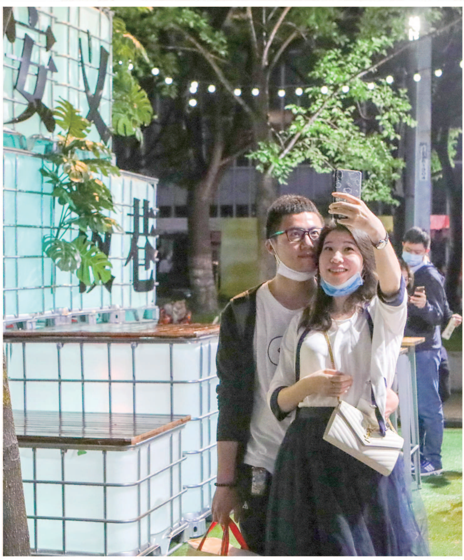
▲一对情侣在“安义夜巷”logo前留下甜蜜合影。