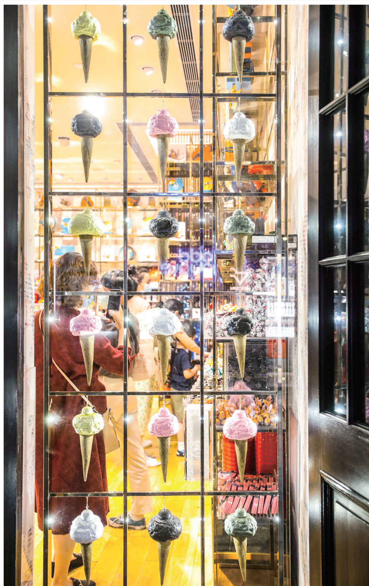
▲拥有逾百年历史的意大利巧克力品牌Venchi 闹饴在新天地开设旗舰店，琳琅满目的巧克力品类和现场制作的冰淇淋吸引众多顾客前往购买品尝。