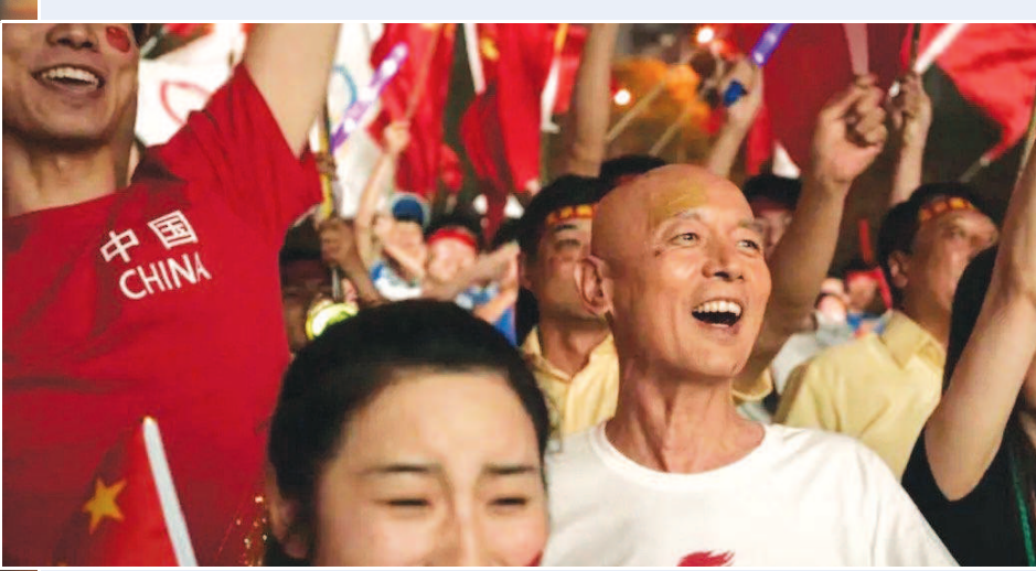
《大江大河》剧照。▲《我和我的祖国》剧照。

“当下一批主旋律影视剧中的角色，跳出了概念先行的脸谱化塑造，充满了个体生命的丰富性与丰盈感。他们解决问题的方式方法，承载了时代与生活背景的‘烙印’。