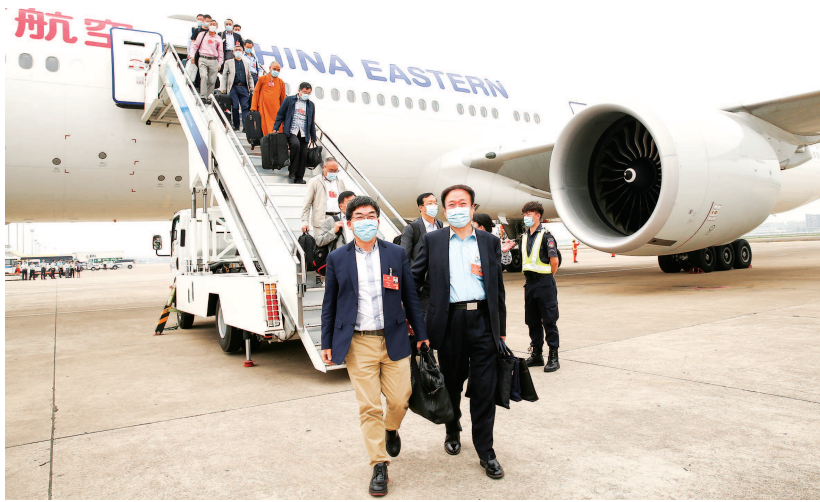
出席会议的在沪全国政协委员昨乘东航班机返回上海。