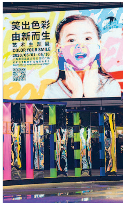
此次公共艺术展旨在由艺术和设计创意方式发起、扩散、传递“爱”“新生”以及正面积积极的力量。

上海南京路步行街投资发展有限公司相关负责人表示,步行街希望通过此次公共艺术主题展览,以南京路为原点,由艺术和设计创意方式发起、扩散、传递“爱”“新生”以及正面积积极的力量。