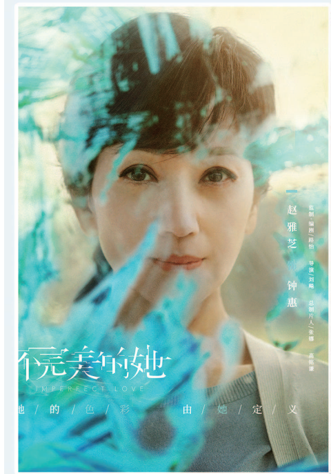
▲赵雅芝在《不完美的她》中饰演钟惠。