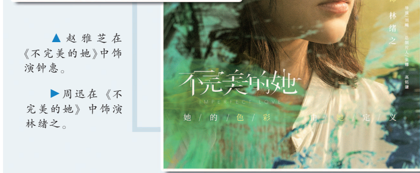
▲周迅在《不完美的她》中饰演林绪之。