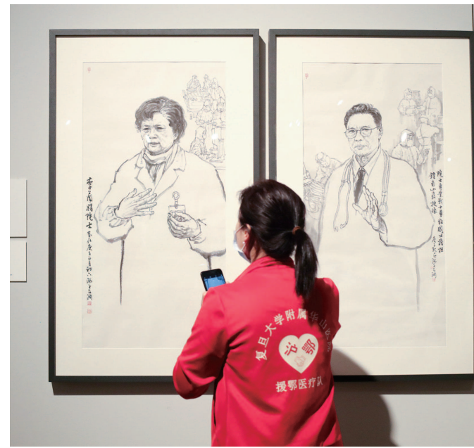
“逆行天使”观看《召唤》主题展。

《召唤》展4月8日启幕，在严格做好防疫措施的前提下，日均观众达1000人。开展两周以来，上海医疗卫生系统、上海抗疫一线的医疗、生产、运输、公安等部门、各类社会基层组织、志愿者以及外籍人士都预约前来观展，主办方则特别组织了讲解员队伍，让观者能沉浸于展览中，随故事而动、随人物而感。