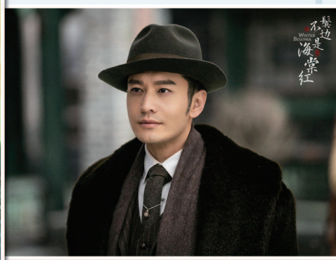
▲黄晓明在《鬓边不是海棠红》中饰演程二爷。

剧将闪光灯打在了国产都市剧中久违了的小人物身上，讲述了个体生命获取尊严的故事。主人公余欢水的遭遇生动诠释了“憋屈”一词：职场上，不逞不抢的他，是狼性企业里业绩倒数的员工，甚至还被自己一手带出来的徒弟嫌弃；家庭中，性格温吞无所作为的他让妻子很不耐烦，连带着在儿子面前也失去了权威。剧中，郭京飞戴着黑框眼镜，说话细声细气，时常耷拉着脸，将一个并不好演的“受气包”，表现得自然生动，又不乏幽默感。其中一幕，余欢水受到惊吓，郭京飞“复刻”了《都挺好》中苏明成被制作成表情包的大叫表情，让观众忍俊不禁。