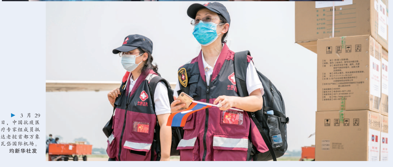
3月29日，中国抗疫医疗专家组成员抵达老挝首都万象瓦岱国际机场。