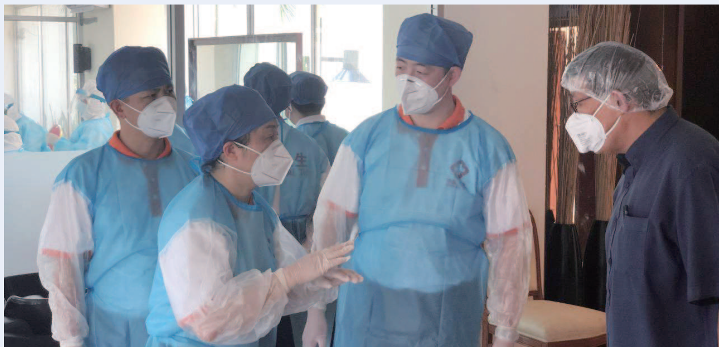
3月28日，在柬埔寨西哈努克市，中国援柬抗疫医疗专家组成员在一个隔离点调研。