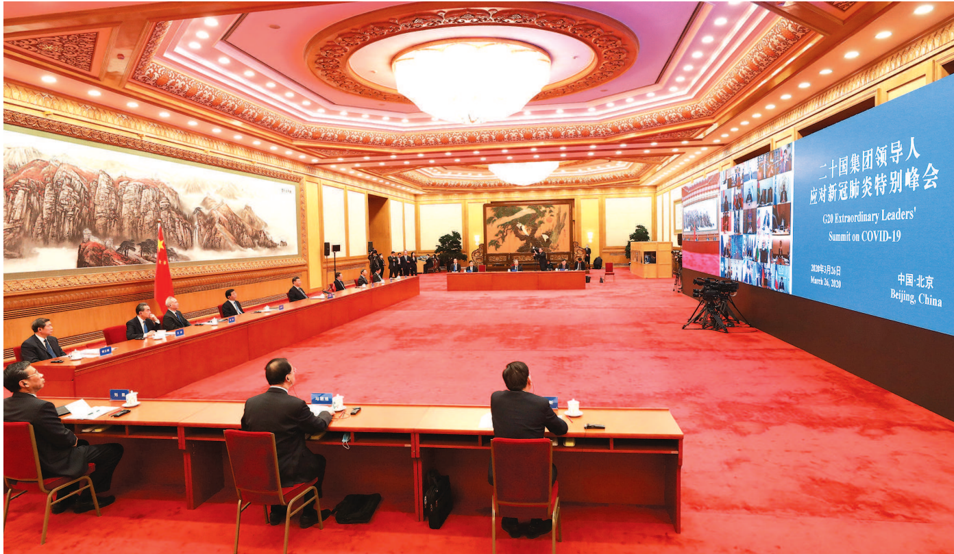
国家主席习近平出席二十国集团领导人应对新冠肺炎特别峰会并发表题为《携手抗疫 共克时艰》的重要讲话。