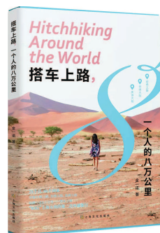
《搭车上路，一个人的八万公里》 金一诺著 上海文化出版社出版