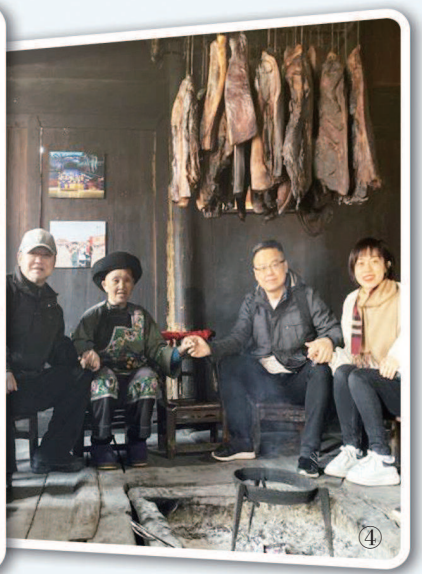
图①《花繁叶茂》剧照。图②《山哈闹海》海报。图③《一个都不能少》剧照。图④《湘西纪事》主创深入湖南多个地方,与村民交流。(均广电总局电视剧司供图) 制图:李洁