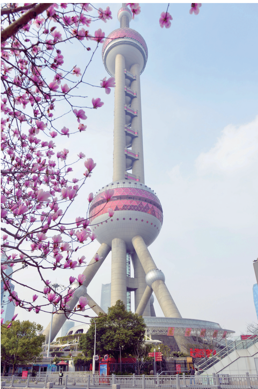
昨天,玉兰花在上海陆家嘴绽放。随着气温回暖,街头盛开的花朵带来浓浓春意。