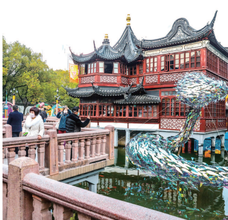
豫园商圈运营工作正稳步恢复。

■绿波廊午市“重启”,南翔馒头店豫园店、松月楼陆续恢复堂食,豫园小商品市场全面复工对外正式营业……目前,豫园商圈的运营时间调整为上午8点半至晚上8点,在主要入口,值守人员包括游客、员工、送货人员等在内的所有人员都严格测温,并要求佩戴口罩、出示健康码。