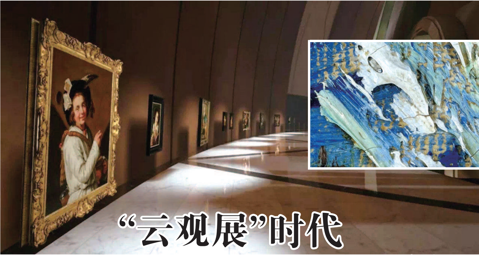
◀彻底底底的虚拟博物馆——克雷默博物馆,不存在于现实世界,只存在于VR中