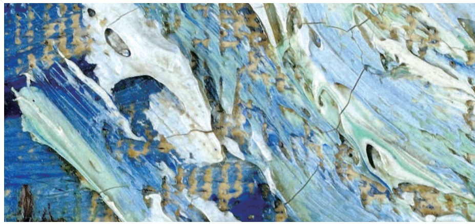
▲在虚拟博物馆里将梵高名作《星夜》放大一百倍之后的效果