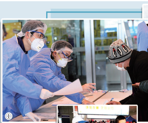
图① 志愿者在虹桥机场指导旅客填写信息。

同时,“上海志愿者网”和微信公众号开辟“疫情防控志愿服务”招募通道,增加人工审核方式,确保志愿者随时随地注册、最短时间完成认证。▼下转第五版