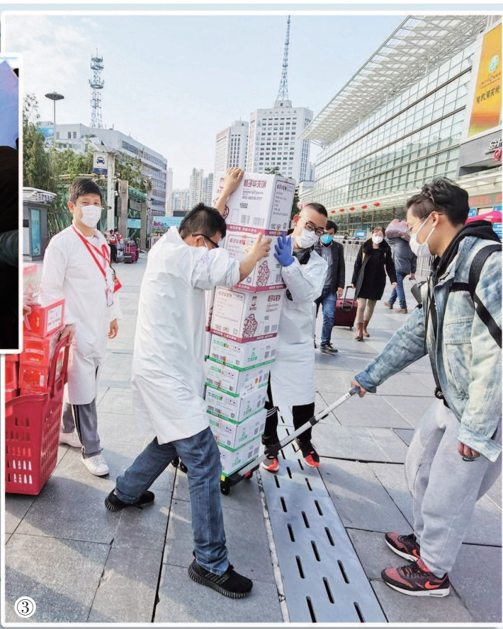
图④ 志愿者在静安区某社区为居民配送物资。