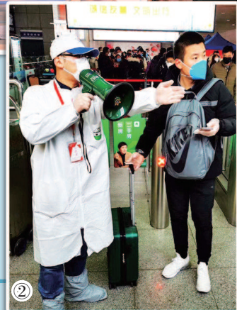
图② 图③ 志愿者忙碌在铁路上海站。