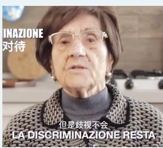
罗塞塔告诉大家不应有歧视。(视频截图)

与罗塞塔老奶奶的暖心话相比，少数西方媒体和政客对中国的“风凉话”“阴谋论”，乃至一些歧视性言论，就显得那么不合时宜和不得人心。比如，世卫组织明明已将新冠肺炎