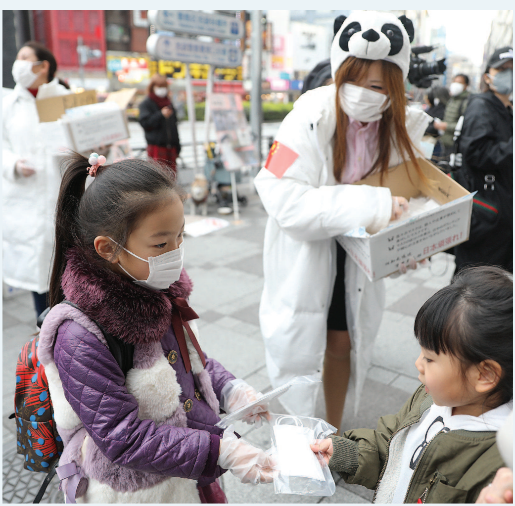
2月29日，在日本东京一名华侨华人小志愿者（左）向当地小朋友发放口罩。

名为“COVID-19”，但一些别有用心的人非要称之为“中国病毒”“武汉肺炎”等。