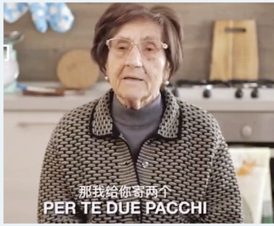
罗塞塔说会给中国人双份“帮助”。(视频截图)