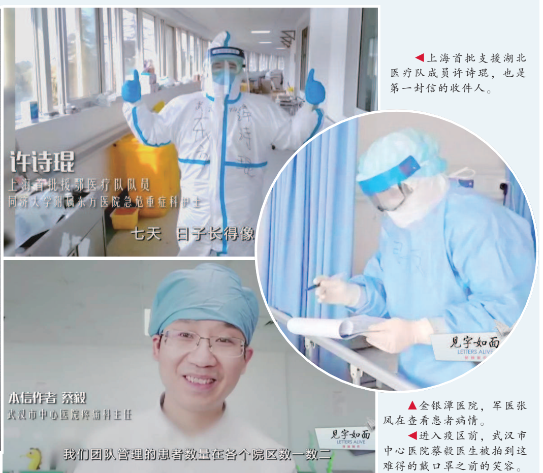
▲《见字如面》抗疫特别制作版海报。

这里，继续救治更多的人，更多小人物，更多武汉市民”。张凤写在 32 岁生日那天的日记里，人们跟着她的讲述，看见“密不透风的防护服、略有雾气的护目镜”，更读到了方舱医院里医患间的相处点滴。“八天，有几个病人已经叫得出我的名字，好心的老太太喊我看新闻里我们的同行”。