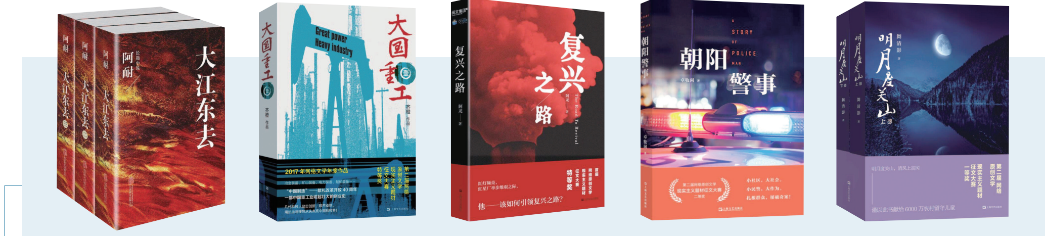
一批网络作家创作的现实题材小说引发广泛关注,如《大江东去》《大国重工》《复兴之路》《朝阳警事》《明月度关山》等。

可喜的是,近年来现实主义书写与网文基因深度融合,补上了“宅”“玄”“空”造成的短板。前不久阅文集团在沪启动“我们的力量”主题征文大赛,《你好普通人》《国家战疫》等讲述各行各业平凡人友爱互助、共战疫情的故事打动了许多网友。上海已连续举办四届现实题材征文大赛,诞生三万多部囊括职场奋斗、文化传承、一线建设的佳作,《复