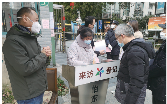
证,为所有车辆办理临时通行证。

原来,自2月8日起,为更好地通过小区自治加强小区防控,同时又尽量提高人员车辆在小区入口的通行效率,塘桥街道富都居民区、仕嘉名苑业委会、小区物业经过多次商量,决定为小区所有人员办理出入