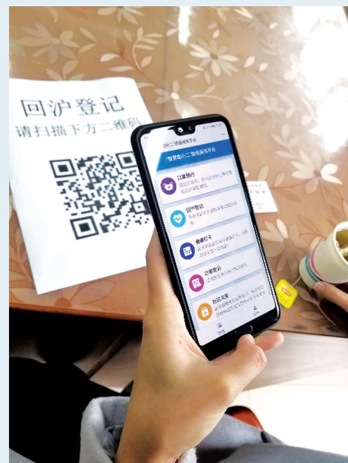
“智慧临小二”线上系统整合了口罩预约、回沪登记、健康打卡、社区关爱、志愿服务等多项信息动态更新功能，在防疫一线实现登记、采集、服务、动员各个环节线上操作。