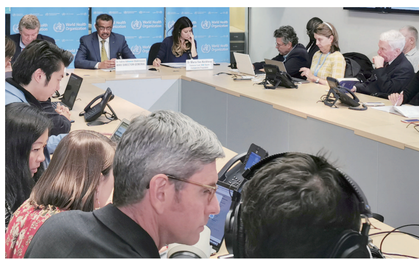
2月7日,在瑞士日内瓦,世卫组织总干事谭德塞(后排中)出席新闻发布会。

谭德塞说,面对新冠肺炎,人们必须获得准确的信息才能保护自己和他人的健康,而错误的信息使医护人员的工作更加困难,它转移了决策者的注意力、引起混乱,并向公众传播恐惧。世卫组织目前不仅仅是在与病毒斗争,还在与散布虚假信息、破坏疫情应对工作的人员斗争。