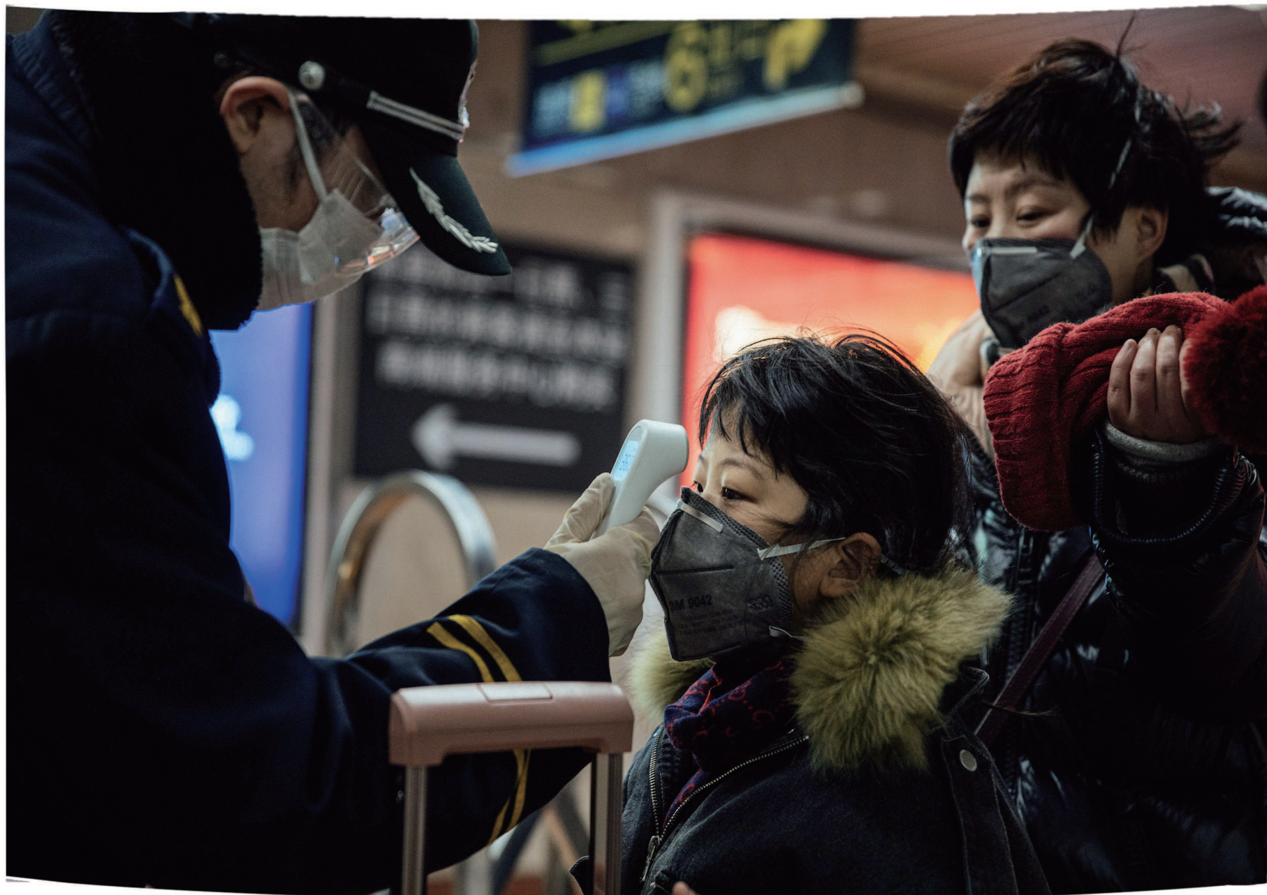
2月3日起，上海地铁首先选择了9座门户车站的23个安检点，采用手持非接触式体温仪开展测温工作。