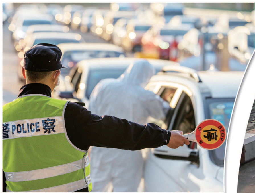
位于G50沪渝高速沪苏省界收费站的沪渝高速检查站是上海的一大门户，青浦公安分局加派警力协助卫生防疫部门开展体温检测。