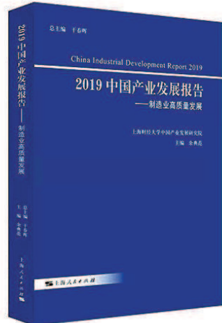
《2019 中国产业发展报告——制造业高质量发展》(余典范主编，上海人民出版社，2019 年 12 月)

本报告立足中国经济由高速增长转向高质量发展的重大战略转变，结合创新、协调、绿色、开放、共享五大发展理念。深入阐述了制造业高质量发展发展的内涵，构建了制造业高质量发展的评价体系，梳理对比了美、日、德等制造业强国的发展经验。在此基础上，从要素升级、深化改革、开放创新、体制机制创新方面深入论证了中国制造业高质量发展之道，并辅以典型的技术、产业、模式案例，对于全面深入了解中国制造业高质量发展具有重要的参考价值。