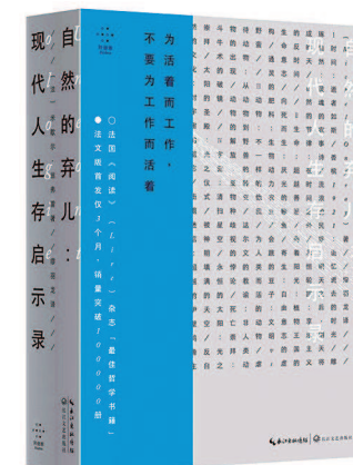
《自然的奔儿：现代人的生死启示录》(【法】米歇尔·翁弗雷著，缪羽龙译，拜德雅·长江文艺出版社，2019 年 2 月)

本报告立足中国经济由高速增长转向高质量发展的重大战略转变，结合创新、协调、绿色、开放、共享五大发展理念。深入阐述了制造业高质量发展发展的内涵，构建了制造业高质量发展的评价体系，梳理对比了美、日、德等制造业强国的发展经验。在此基础上，从要素升级、深化改革、开放创新、体制机制创新方面深入论证了中国制造业高质量发展之道，并辅以典型的技术、产业、模式案例，对于全面深入了解中国制造业高质量发展具有重要的参考价值。