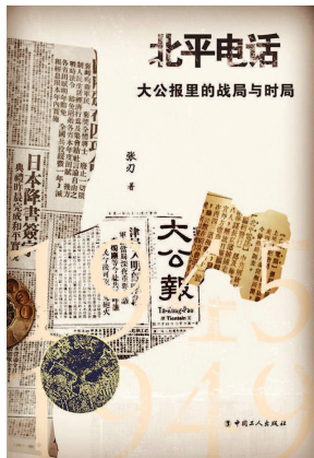
《北平电话——大公报里的战局与时局》张刃著 中国工人出版社出版

1945年10月10日，故宫太和殿举行了华北战区日寇受降仪式，北平光复。光复之后，北平的社会任务是明确的——接收和重建，此时北平局势依然混乱，日寇侵占多年搜刮压榨以及刚结束的战乱令百姓生活无比困苦。但“重庆来的人”治理手段不比日寇高明，贪婪或有之，“五子登科”之丑恶现象令时人侧目。这四年的北平，是座混乱和呐喊之城——工农商业凋敝，物资短缺，物价飞涨。大公报针对这些现象发出温和却直指问题根源的质问：“接收工作未能给人民以温暖……接收人员的失职，政府要负的责任实比个人为大。日军为何不缴械？大