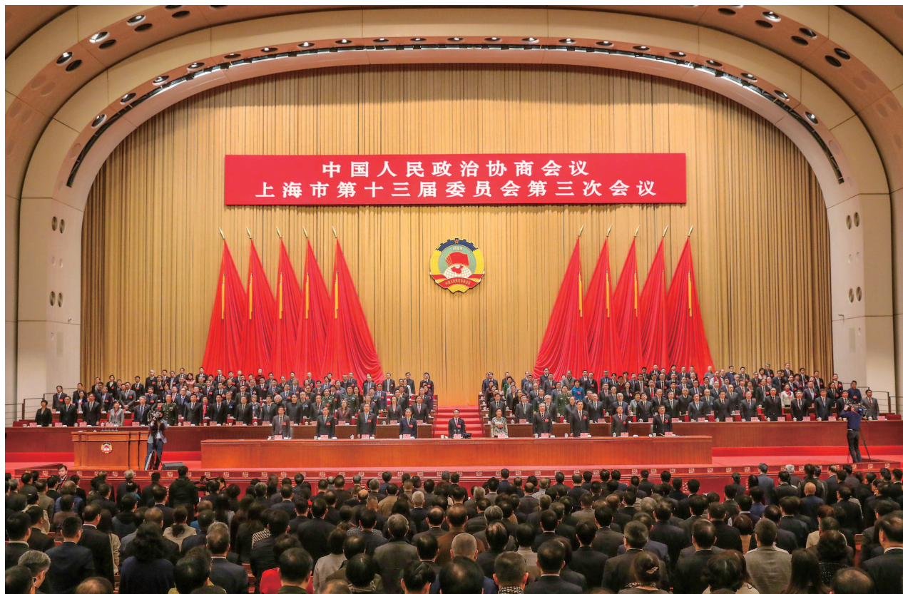
昨天,市政协十三届三次会议胜利闭幕。

要深入贯彻落实习近平总书记考察上海重要讲话精神,更好发挥政治优势、制度优势,同心同德、群策群力、善作善成,奋力创造新时代上海发展新奇迹