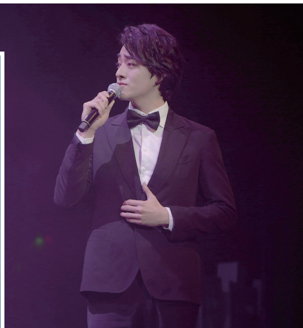
▲郑云龙演唱剧中歌曲《只有你最懂》。