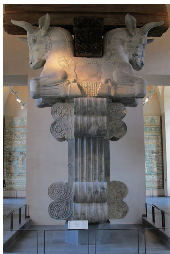
▲波斯帝国大流士宫的 双牛柱头,现藏卢浮宫

希腊,亚历山大之前,根本没有大帝国。所谓“帝国”只是个盟主。比如公元前 454 年,雅典称雄,西人也叫 empire。这样的盟主,按咱们的说法,顶多是个“霸”,充其量只是地区性霸权,跟秦汉帝国根本没法比。秦汉帝国,在东亚地区是世界性的大帝国。