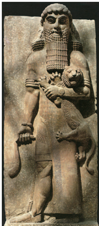
▲亚述浮雕《男人抱幼狮图》

《波斯笔记》系统详实地整理了波斯帝国的历史,用“我们”的眼光重新审视了东西之争和欧亚大陆两千年以来的文明进程。全书分为上下两册,上篇“历史-地理篇”涉及波斯帝国的政治、疆域、制度、宗教,下篇“考古-艺术篇”介绍了宫殿、石刻、艺术品、博物馆文物。