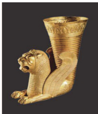
▲精美的阿契美尼德王朝金器

第三是与中国关系很密切。中国和波斯,自古往来,史不绝书。不仅金银珠宝、瓷器丝绸,贵重商品,互通有无,动植物也有很多交换。比如狮子初入中