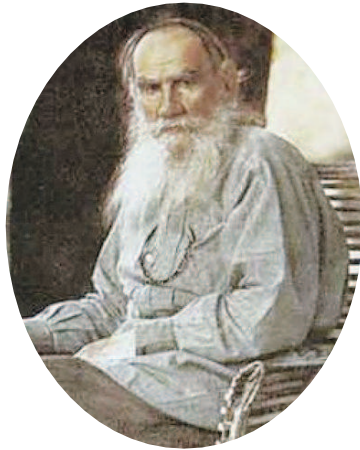
列夫·托尔斯泰唯一一张彩照。(摄于1908年5月)