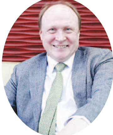
弗拉基米尔·托尔斯泰近影。