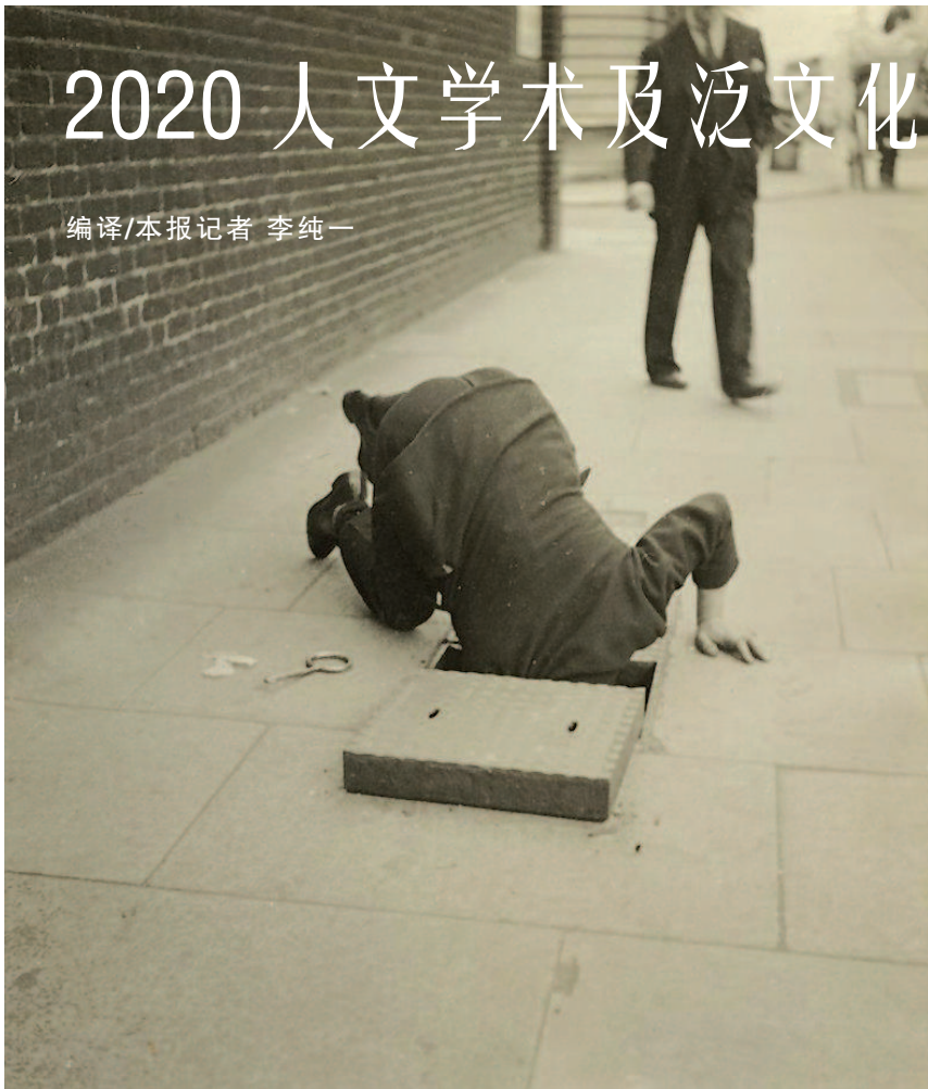
题图:朵拉·马尔摄影作品《探进人行道检查盖》

《文匯學人》综合《经济学人》、《星期日周报》等大事历,《艺术新闻》、BBC、彭博社等展览历,部分大学出版社大众图书春季目录、《卫报》书历等,列出其中人文学术与泛文化相关部分日历。