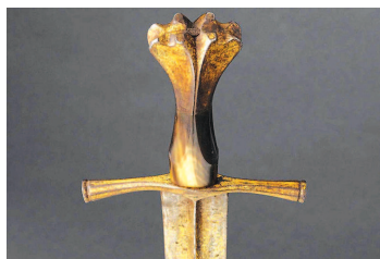
米兰大公的剑(15世纪下半叶)