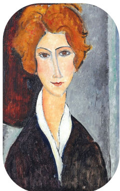
莫迪利亚尼《女性肖像》(作于1917—1918)