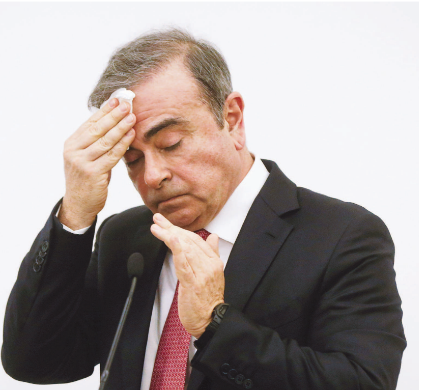
1月8日，在黎巴嫩首都贝鲁特，卡洛斯·戈恩在记者会上擦汗。这是他自去年11月底离开日本抵达黎巴嫩后首次公开露面。

此外，日本内阁官房长官菅义伟9日批评戈恩言论“一面之词，毫无说服力”。东京地方检察院也罕见地评论称，对于戈恩的控诉“断然无法接受”。同时，日本媒体也根本不买账。日本主流媒体的报道普遍对戈恩的说辞颇为不屑，“真没罪的话不要逃就不好了”“为什么不敢堂堂正正地接受审判”等论调出现在电视评论员的口中。日本《文艺春秋》发文称戈恩在“诡辩”。(本报东京1月9日专电)