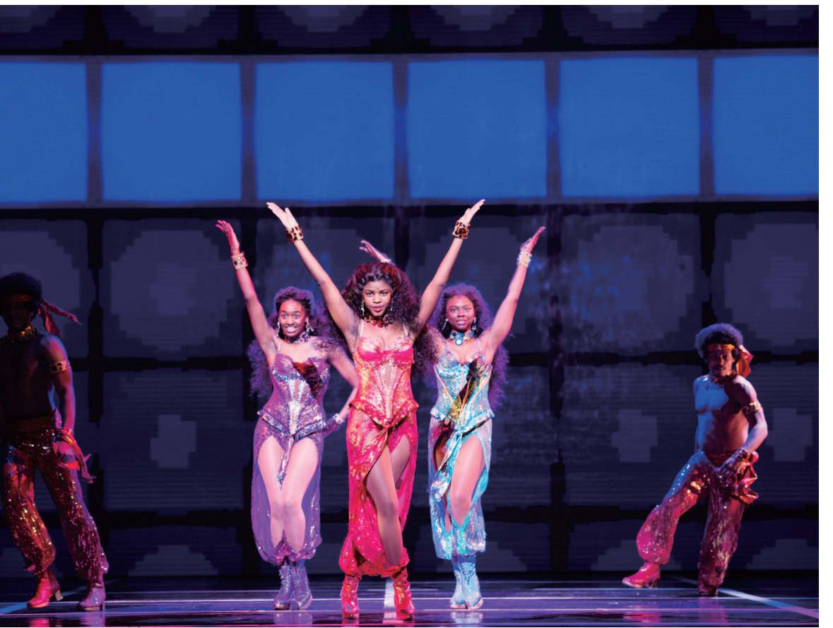
音乐剧《追梦女郎》中的女孩们为梦想逃离贫民窟，功成名就后却发现已失去自由。这丝无奈也为星光闪耀的剧情抹上了悲情和伤感的色彩。

演员则表示，虽然他们没有经历过上世纪60年代的种族隔离，但对美国种族问题的现状也有自己的体会，并融合在演绎中。剧中饰演小柯蒂斯·泰勒的杰里米·欧文，曾是传奇阿波罗业余百老汇之夜的第一名得主。即便如此，他发现在百老汇面临同一个角色时，白人演员总是比作为黑人的他更易成功，并为观众接受。“黑人演员只有更优秀、更努力，才能获得同样的机会。作为有色人种，在美国娱乐圈工作会面临诸多挑战，平权问题上我们还有很长的路要走。”