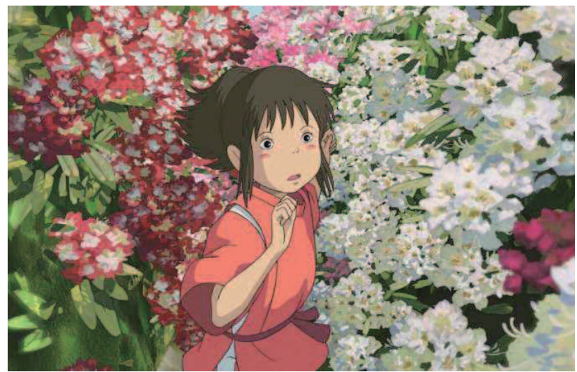
宫崎骏旧作《千与千寻》去年6月在国内上映后取得不俗票房,图为剧照。

中国目前约有1700万视障人群。郑大圣说:“庆幸上海能做这样一件事情。城市的文明不仅取决于摩天大楼的高度,同样体现在细节的温度。更希望的是,未来这些视障观影的消息不再成为新闻,而是以一种司空见惯的常态,成为生活一部分。”