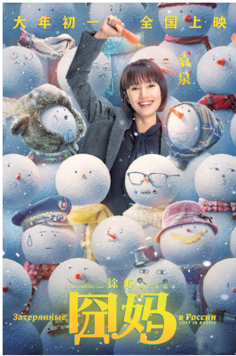
徐峥自编自导自演的《囡妈》已完成了无障碍音轨制作,将于大年初一与正式版同时登陆院线。图为该片海报。

事实上,作为国内无障碍观影行动启动最早的城市,上海早在2008年就开始致力于为视障人士打开