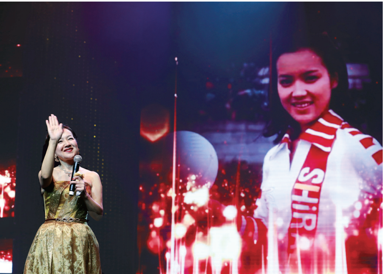
荒木由美子所饰演的“小鹿纯子”是许多中国观众最熟悉的日本荧屏形象之一。作为复出后的首次正式亮相,昨天,荒木由美子在中国大戏院举办《世纪唱响·音乐桥梁》演唱会,这也是她中国巡演的第一站。

虽然距《排球女将》热播已过去近40年,荒木由美子对当年拍摄《排球女将》的趣事记忆犹新,她说:“我以前体育成绩很一般,但完成拍摄后,每一项体测都是第一名,可以说是意外的收获。”电视剧中,“小鹿纯子”的招牌绝技“晴空霹雳”,先在空中有一个360度前空翻,再顺势大力扣球,虽然其中有特效的部分,但当年拍摄过程中是没有替身的,所有动作必须由演员完成。《排球女将》播出后很受欢迎,以至于导演和编剧不得不将作品加长到71集,这在日本影视史上也极为少见。荒木由美子因此成为一颗耀眼的新星,备受影视圈关注。