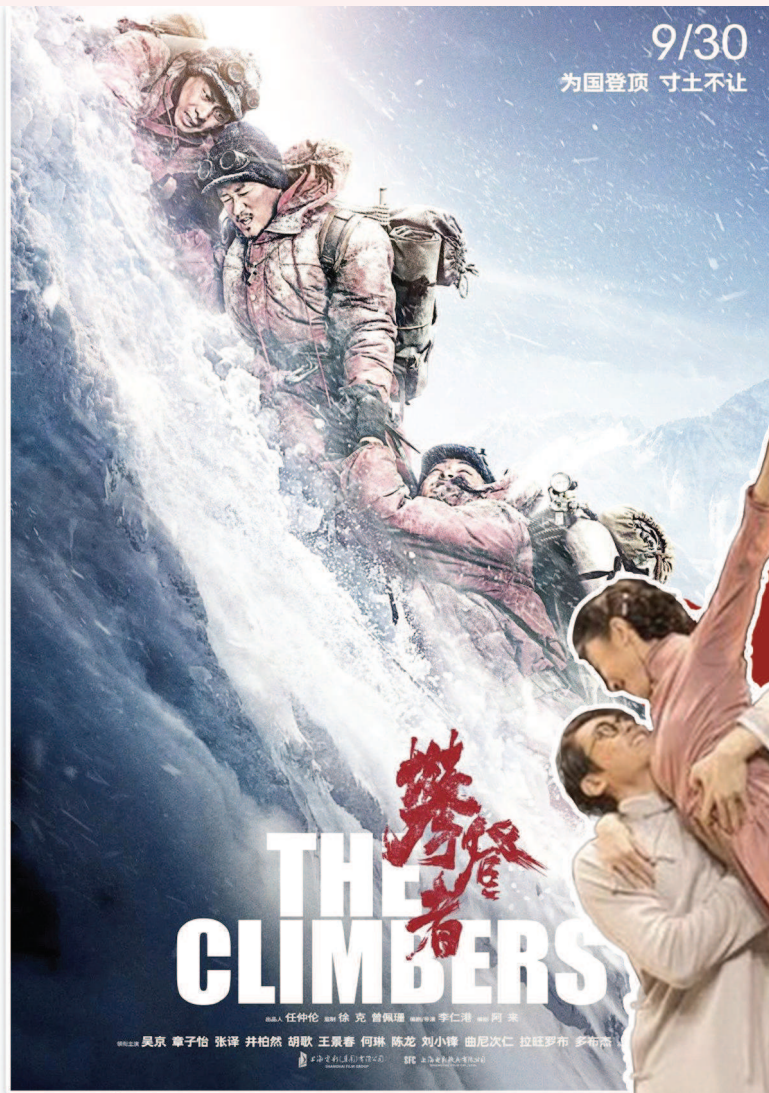
9/30 为国登顶 寸步不让

后抵达沸点。大银幕上,主旋律电影迎来了前所未有的高光时刻,国庆七天票房突破了50亿元,三部献礼片在观众的久久回味里最终获取71.1亿元总票房。银幕上重新拆解荡气回肠的历史,一批生动鲜活的中国、拥有永恒魅力的中国精神、中国价值、中国力量,成为市场的最强引擎。 直到今天,或许直到更远的未来,观众依然会对2019年的“史上最爱国庆”留下的台词念念不忘—— “零零零升起中国国旗,这是我们的底线!”《我和我的祖国》之“回归”篇里,中国外交官与英方谈判,16轮寸步不让。他说,游子回家,“中国已等了154年,我们不能再多等一秒”。 “报告大本营,报告北京,报告祖国……中国登顶了!”《攀登者》中,1975年九位勇士代表中国从北坡第二次登上世界之巅,英雄的呼号里凝结着一代代中国人民筚路蓝缕奋斗不息的山一程水一程。