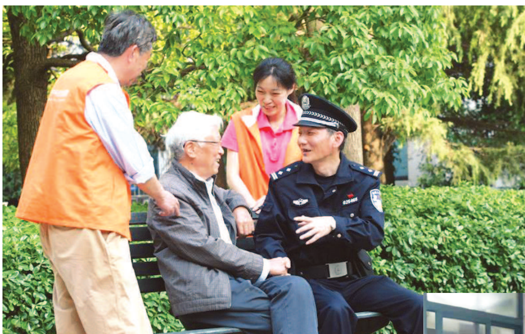
引导政法干警坚定理想信念、提高履职能力，构建公平高效法治环境，服务保障民生。

区公安分局在全市首创闭环式非警务分流处置机制，推进服务零距离；在全市率先处置“职业打假人”敲诈勒索案件、侦办恶意“刷单”骗取电商返利案件、破获假冒“高达”侵权案件等；在服务民生方面，围绕8个长宁“夜间经济”示范点，挖掘道路停车资源，增加约20%的临时停车位；积极推进“一网通办”，将派出所窗口受理项目从26项拓展到48项；截至11月底，公安政务服务事项网上办理量达9万余件，让群众“不找警种、不分区域、一次办成”。