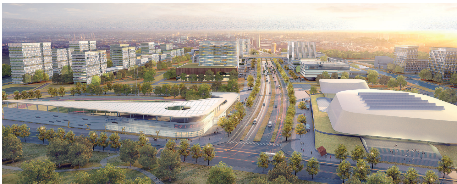
上海立信会计金融学院新校区规划面积1120亩，2022年将首先完成一期东区建设。