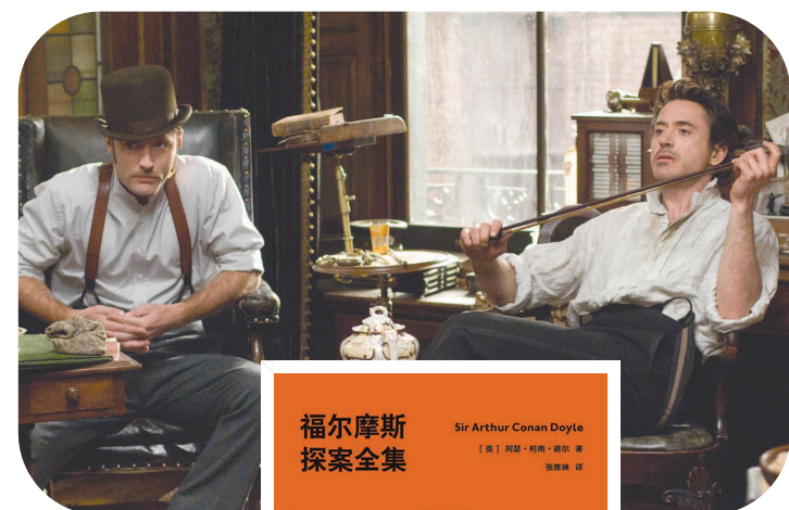
▲电影《大侦探福尔摩斯》剧照

举例来说，他曾看了一位穿便服的病人一眼，就说他刚退伍，是苏格兰高地军团的军官，更厉害的是，贝尔还发现他曾在巴巴多斯服役过。若未细想，会认为贝尔只是幸运猜中，或是在玩把戏，但这些观察是全部有逻辑根据的。贝尔解释他的思考过程：“他是一名受人尊敬的男人，进房时却没有脱帽。因为在军中大家都没有这个习惯，如果他退伍够久就会重新习惯这个礼仪。他有着军官的威严，而且很明显是苏格兰