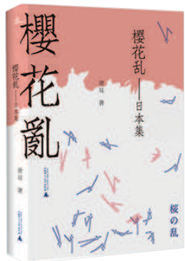
《樱花乱——日本集》 萧耳著 广西师范大学出版社出版

世间的风物殊奇，人生的景致也是参差错落，一个人即使是行了万里路，读了万卷书，若没有一颗会欣赏的心，一切风情景物，也就都寡淡无味了。