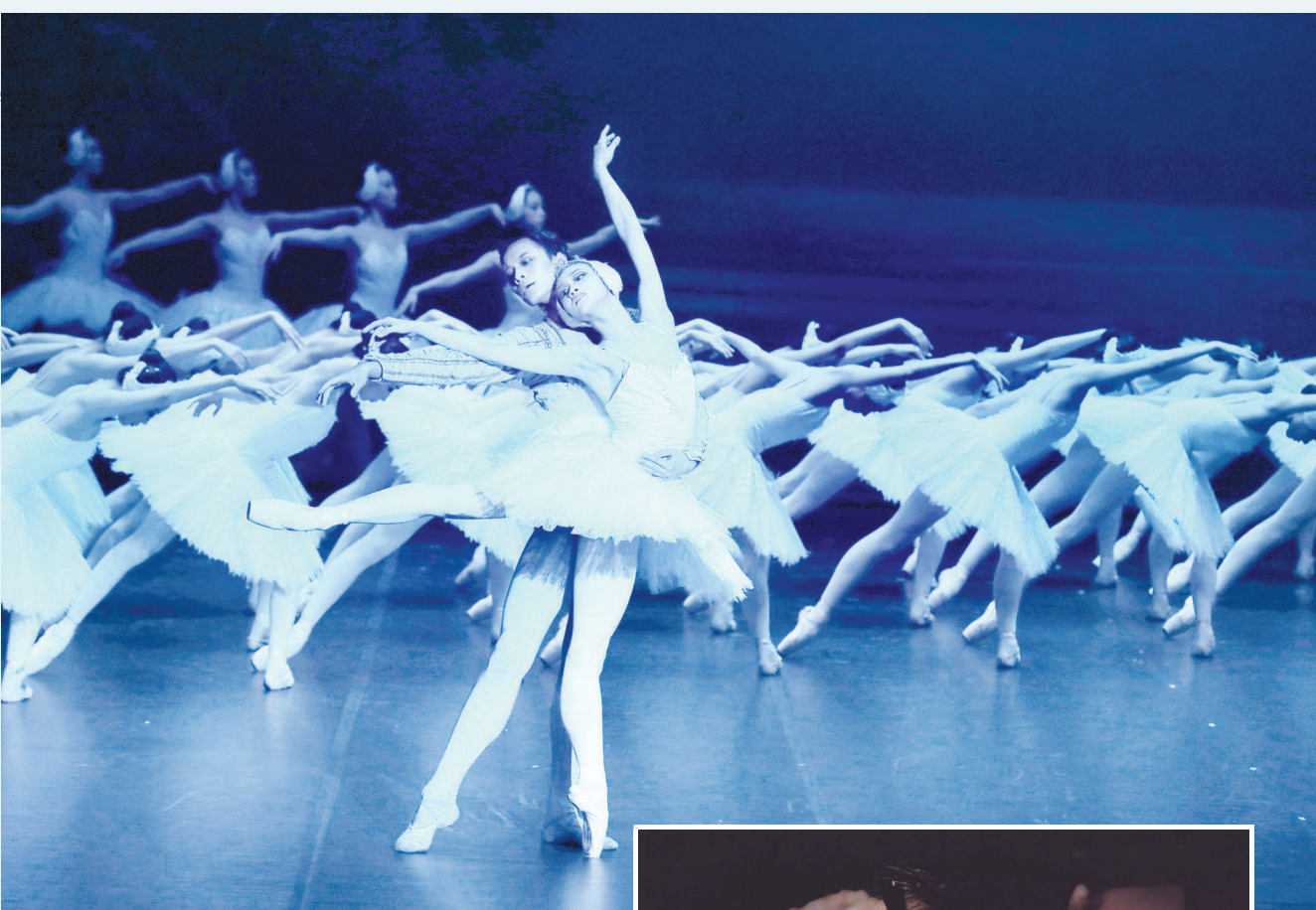
▲上海芭蕾舞团演绎经典版《天鹅湖》。