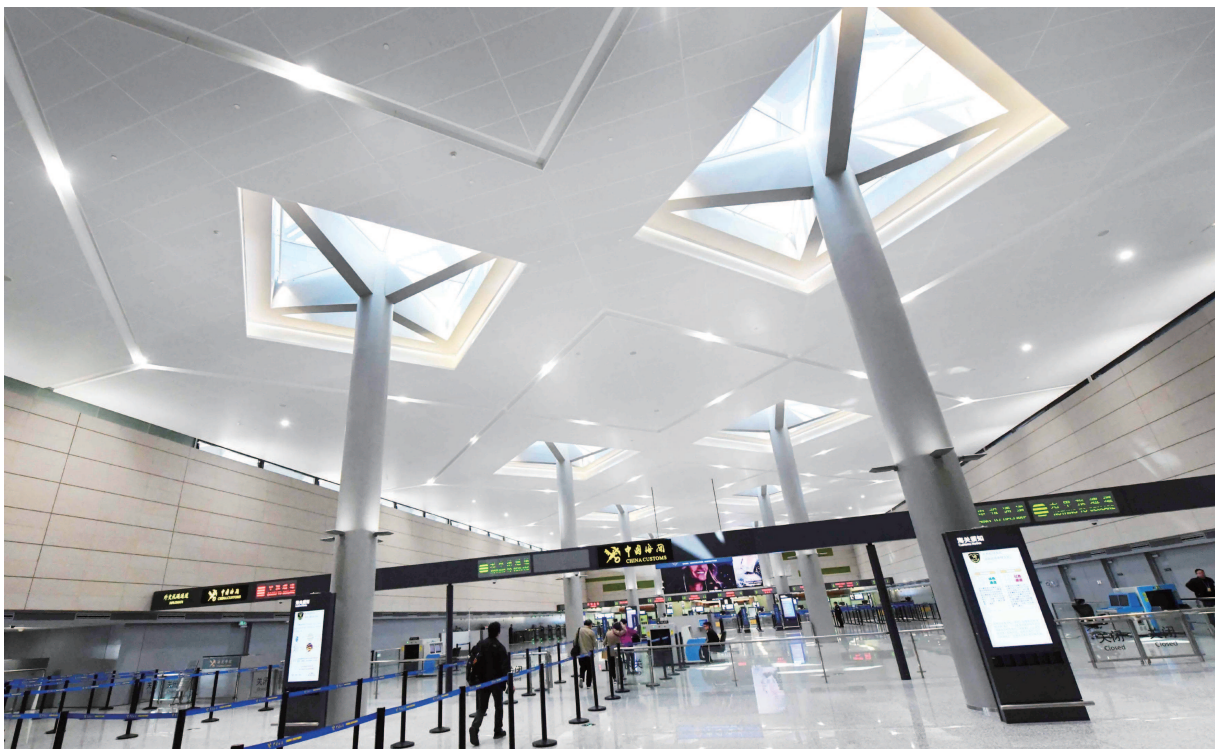
虹桥机场利用顶棚透光实现照明节能环保。

不久前,上海在国内率先上线“余热资源服务平台”,相当于打造了一个“余热交易的淘宝”。开通4个多月来,卖家上传了超