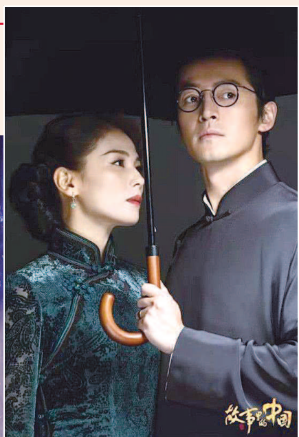
▲胡歌、刘涛领衔舞台表演，扮演《永不消逝的电波》中的李侠夫妇。 ▲陈数饰演江姐，致敬《烈火中永生》的经典段落。