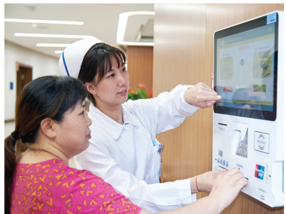
医护人员指导市民使用自助住院一体机。

据统计，“零跑动、全自助”一站式出入院新模式在胸科医院的部分示范病区试行以来，患者各类等候平均时间大幅下降。住院押金交付时间由之前的6.21分钟下降到1.56分钟，检查预约时间由2.75天缩短到1.42天，术前等候时间由3.66天减少到2.25天，出院结算时间从4.52分钟缩短到2.41分钟，新模式赢得病家高度好评。 下转第五版