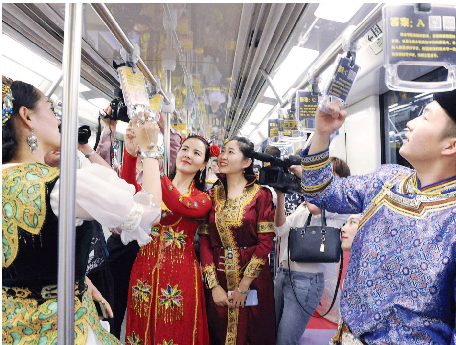
各族群众乘坐上海地铁十号线民族团结号列车。

马陆镇有着“上海吐鲁番”的美誉，这里出产的葡萄甜美可口，当地在推进城市民族服务管理方面打造的“葡萄架下民族情”品牌更为暖心。 下转第三版