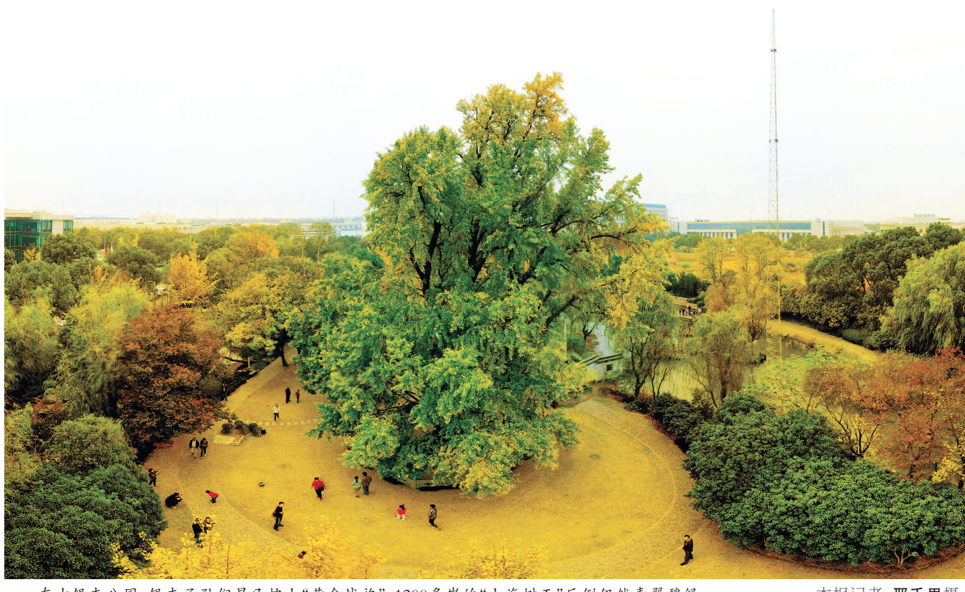
在古银杏公园,银杏子孙们早已披上“黄金战袍”,1200多岁的“上海树王”反倒仍然青翠碧绿。

千年古树的生命力令人震撼——高24.5米,胸径6.5米,冠幅硕大无比,树根分布好几亩地。 ▼ 下转第三版