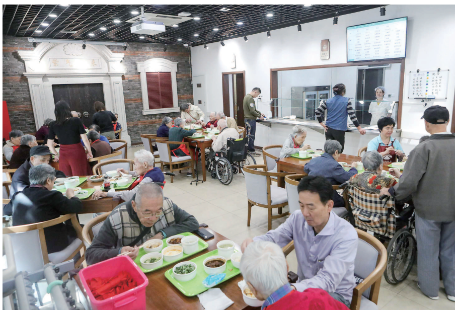
中午时分,南京西路街道社区为老服务中心人头攒动,社区老人在此享用午餐。

针对辖区东北角乐龄助餐点缺失、新成居委会硬件设施薄弱的现状,南京西路街道启动新成居委会办公及综合服务用房整体改造提升,以此深化为老服务。▶ 下转第三版