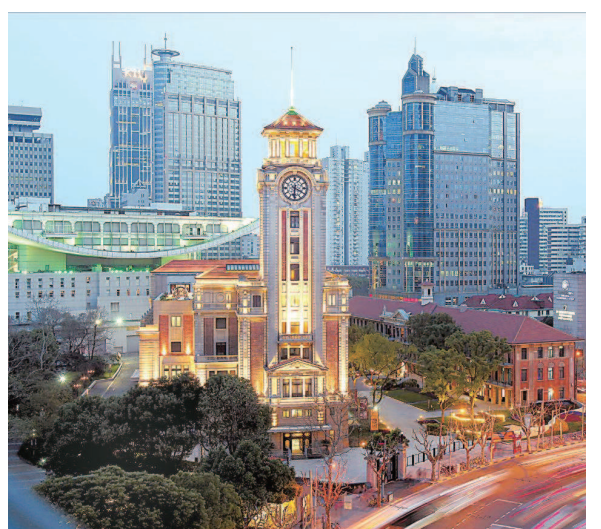
华灯初上,上海市历史博物馆显现出了她迷人的另一面。

一方面相关机构尝试将每栋老房子的故事、结构、修缮历程,甚至工艺的细部,均作为历史记载下来。另一方面,在保护文物本体的同时,对文物周边环境、文化生态实施整体保护。▶ 下转第三版