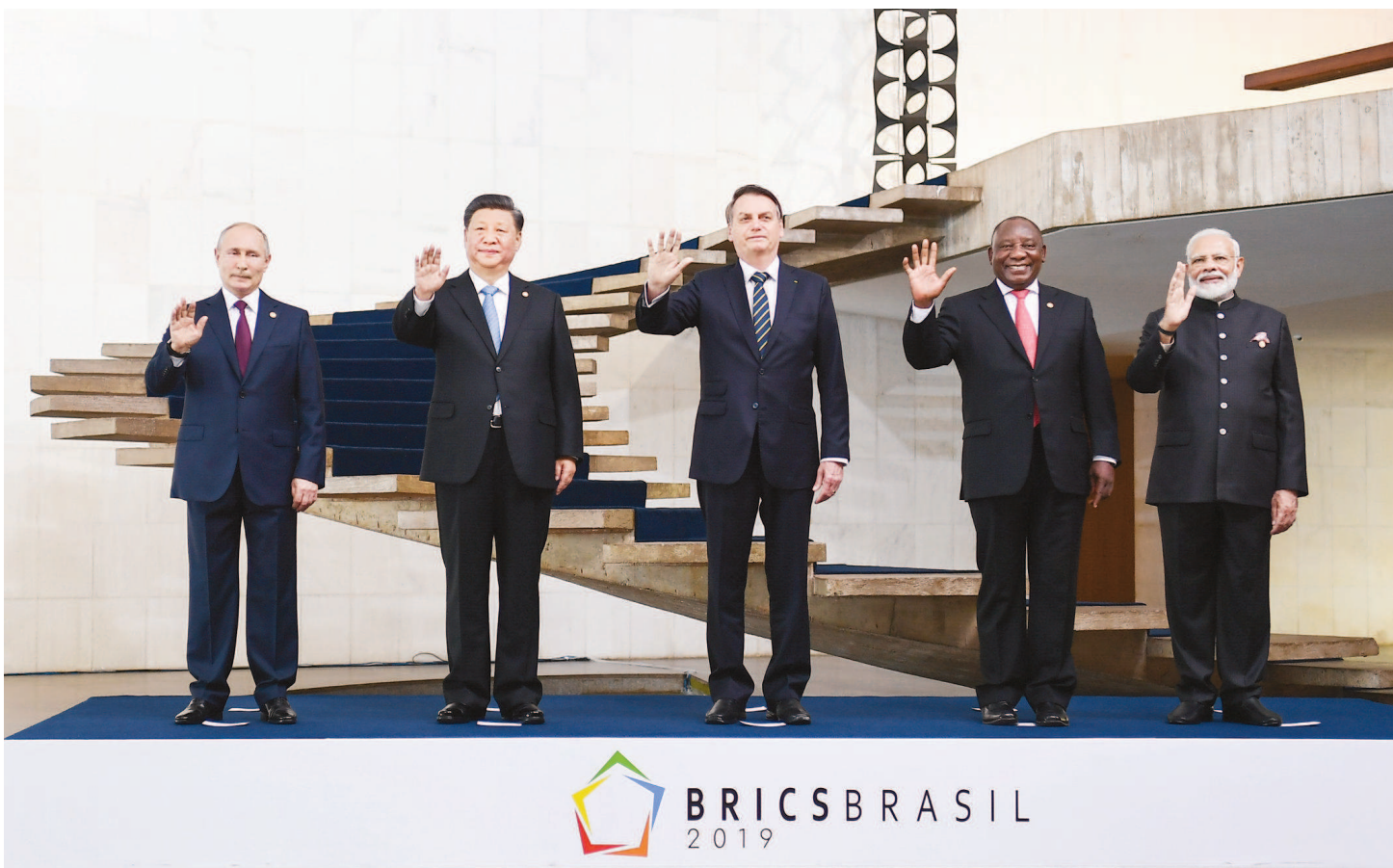
当地时间11月14日,金砖国家领导人第十一次会晤在巴西首都巴西利亚举行。巴西总统博索纳罗主持会晤。中国国家主席习近平、俄罗斯总统普京、印度总理莫迪、南非总统拉马福萨出席。这是五国领导人合影。

本报巴西利亚11月14日专电 (驻巴西利亚记者张峻榕 特派记者周俊羽) 当地时间11月14日,金砖国家领导人第十一次会晤在巴西首都巴西利亚举行。巴西总统博索纳罗主持会晤。中国国家主席习近平、俄罗斯总统普京、印度总理莫迪、南非总统拉马福萨出席。五国领导人围绕“经济增长打造创新未来”主题,就金砖国家合作及共同关心的重大国际问题深入交