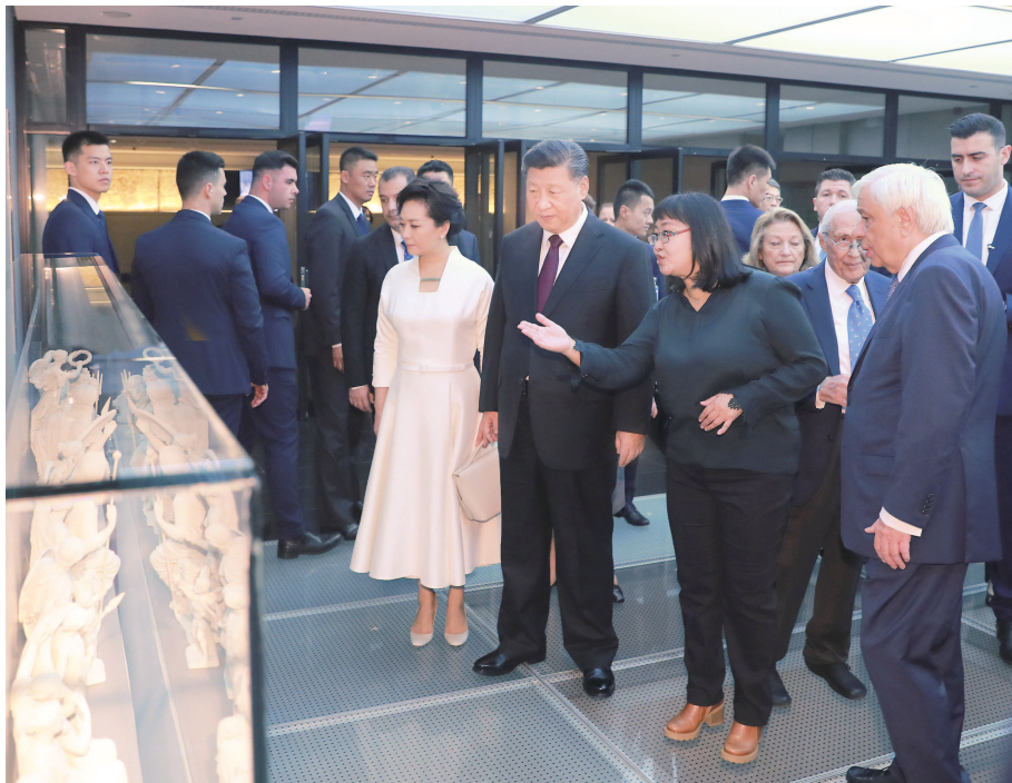
习近平和夫人彭丽媛在希腊总统夫妇陪同下,参观雅典卫城博物馆。新华社记者 丁林摄

比雷埃夫斯港项目是中希双方优势互补、强强联合、互利共赢的成功范例。希望双方再接再厉,搞好港口后续建设发展,实现区域物流分拨中心的目标,打造好中欧陆海快线。我相信比雷埃夫斯港的前景不可限量,合作成果一定会不断惠及两国及地区人民 伟大的希腊人民孕育了奥林匹克格言,发展中希关系同样需要坚持“更快、更高、更强”的奥林匹克格言。希望双方以务实合作和文明对话“双轮”驱动全面战略伙伴关系发展,为世界和平、共同繁荣作出新贡献