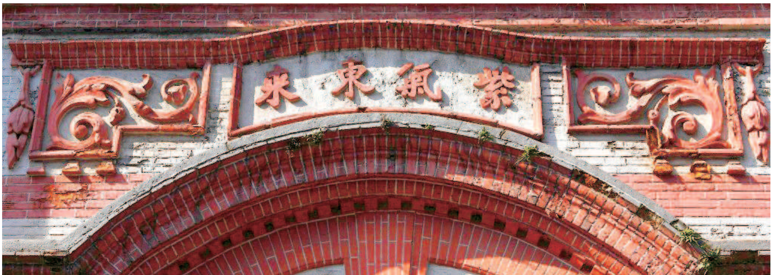
1919年后，张园逐渐成为石库门里弄，宽大的联排石库门房屋，仿江南民居居式里弄布局，是上海石库门里弄的典型代表。图为张园外景。